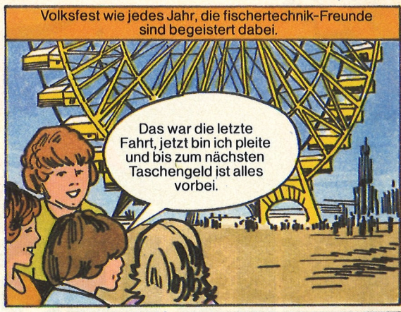
Volksfest wie jedes Jahr, die fischertechnik-Freunde sind begeistert dabei.

Das war die letzte Fahrt, jetzt bin ich pleite und bis zum nächsten Taschengeld ist alles vorbei.